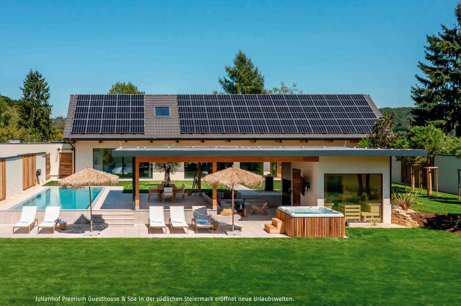
Julianhof Premium Guesthouse & Spa in der südlichen Steiermark eröffnet neue Urlaubswelten.